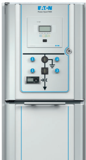
Power Xpert® FMX