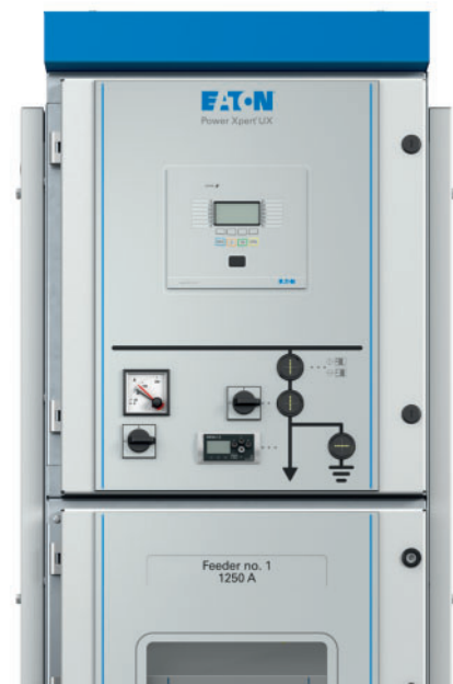
Power Xpert® UX