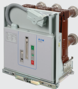
Автоматические вакуумные выключатели серии W-VACi